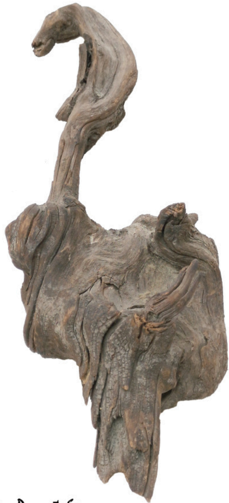
Miech planeetan Proncto Saurus.