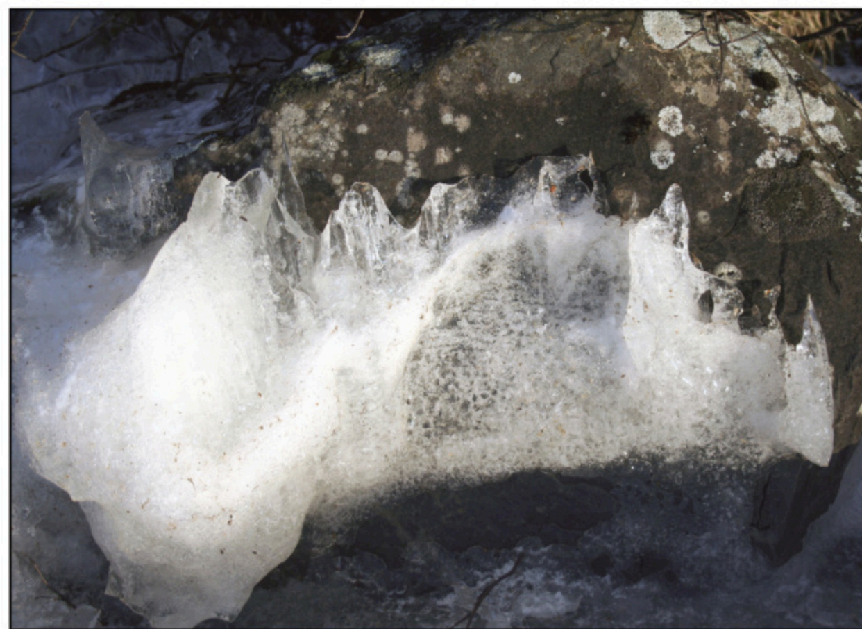
Jääpatsas prinsessasta hovinaisten seurassa.