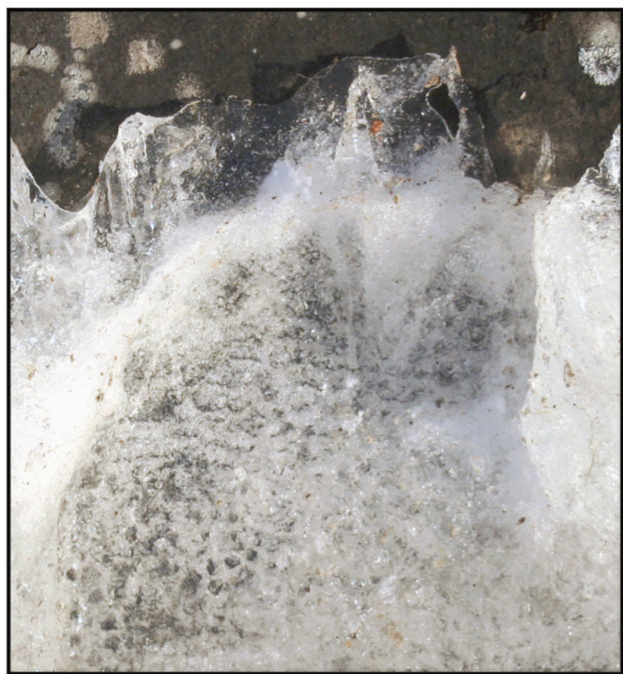
Isecan prinsessa Taican jääveistos.